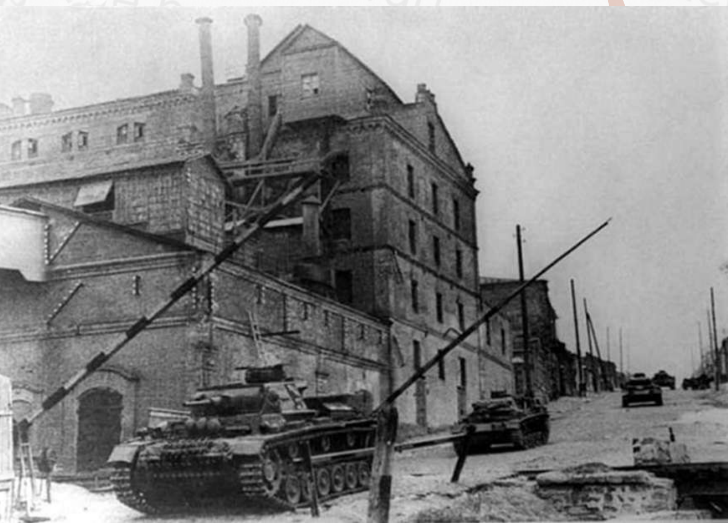
Немецкие танки на ул. 29-я Линия в Ростове-на-Дону.