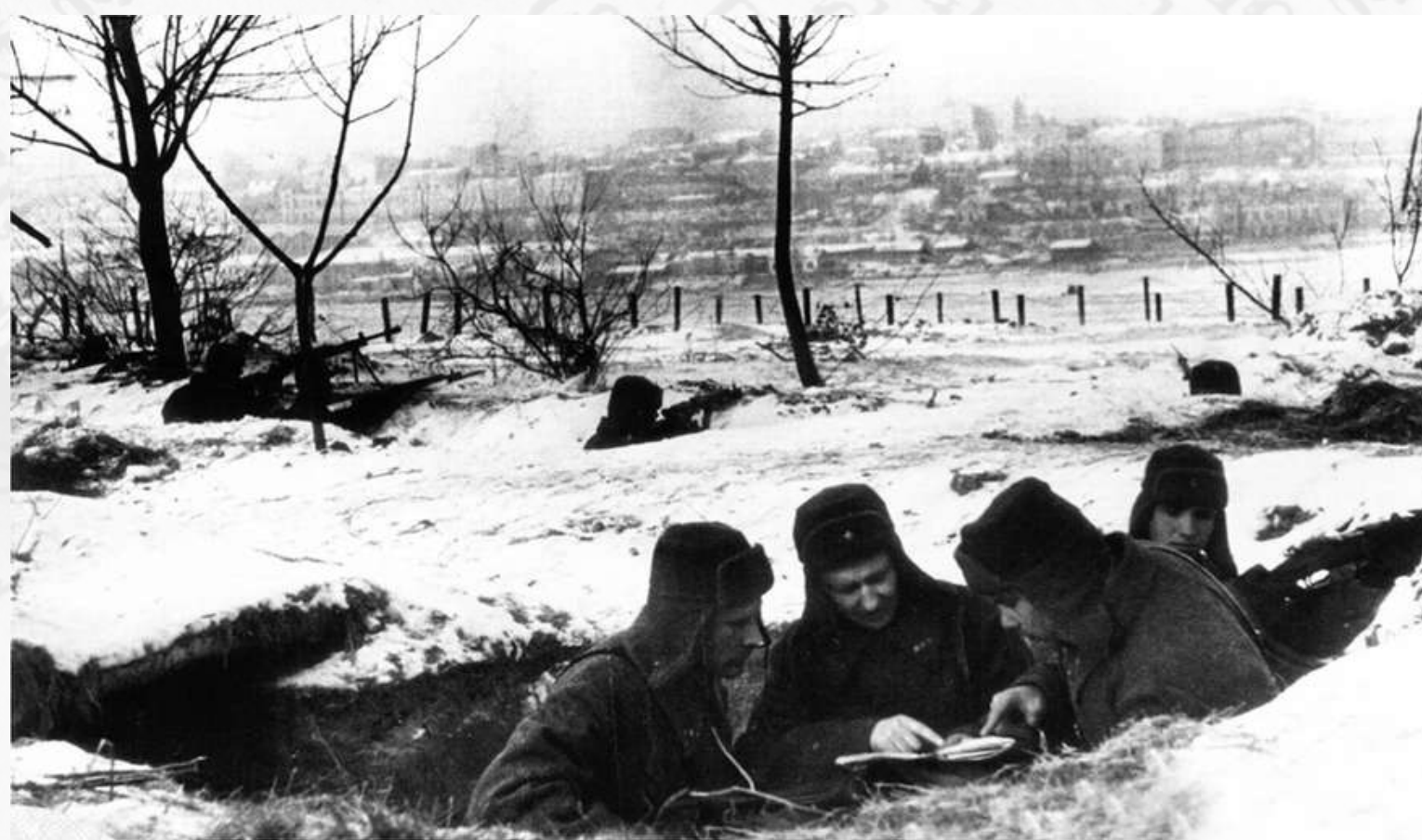
Штурм Ростова-на-Дону бойцами РККА с левого берега.

После освобождения Ростова нашим войскам удалось отогнать противника на несколько десятков километров на запад за реку Миус. Крупное поражение немецких войск заставило их в срочном порядке перебрасывать силы с других участков для стабилизации линии фронта. Что во многом помогло обороне Москвы и Ленинграда. Рухнули планы Гитлера добраться до нефтепромыслов Баку и, что не менее важно, возможность их бомбардировки была также почти исключена. Немецкой армии пришлось встречать зиму по линии фронта, проходящей в поле, к чему они были плохо готовы. Крупная победа Красной армии под Ростовом имела также и важное значение для морально-психологического состояния нашей армии.